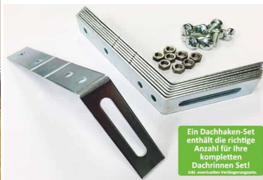
Dachhaken Set für PVC | Satteldach