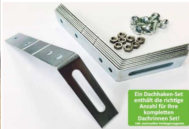
Dachhaken Set für PVC | Satteldach